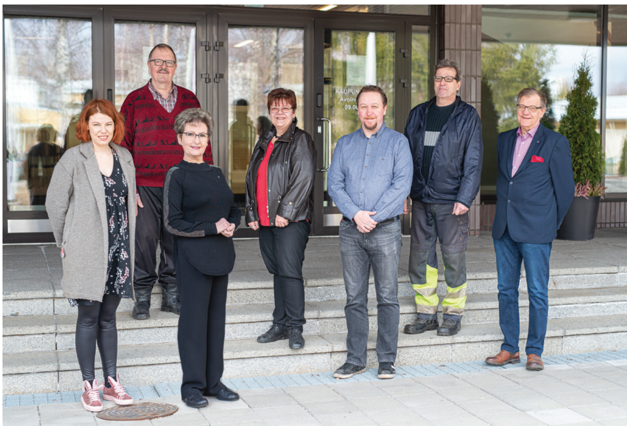
Kuvassa Tarkastuslautakunnan kokoonpano 2019