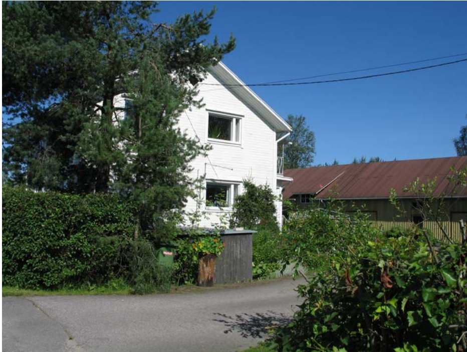
Kuva. Kadunpuoleinen julkisivu.

Asuinrakennus on kaksikerroksinen puurakennus, jossa on purueristys. Rakennus on rakennettu vuonna 1958. Rakennuslupapiirustukset on laatinut rkm M. Tolonen. Vuonna 1973 on haettu lupaa muuttaa Mallastamon julkisivuja aaltopeltisiksi, väriltään vihreä. Nykyinen pystyprofiloitu peltipinta on kellertävän värinen. Siinä on tumman ruskeat listat. Asuinrakennus on väriltään valkoinen. Rakennukset ovat hyvässä kunnossa.