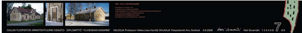
Yllä kuva em. diplomityöstä. Alempi kuva on 1980-luvulla kunnostetun rivitalon pihanpuoleista julkisivua.