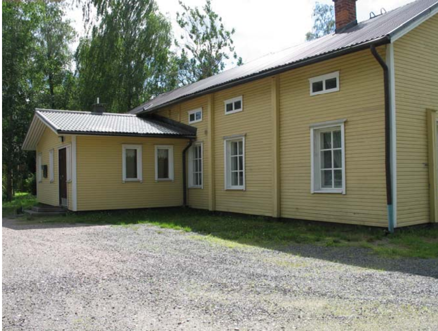
Kuva. Kadunpuoleinen julkisivu.

Siltalan seuratupa on vanha hirsirakenteinen puurakennus, joka on rakennettu kivijalan päälle 5" (125mm) hirsirakenteena ulko- ja väliseinien osalta. Rakennus on yhdistetty seuratuksi kahdesta hirsirakennuksesta ja ulkopinta on koolattu suhteellisen suoraksi ja vuorattu vaakaponttilaudoituksella, joka on pinnoitettu öljymaalilla. Rakennus on hyvässä kunnossa.