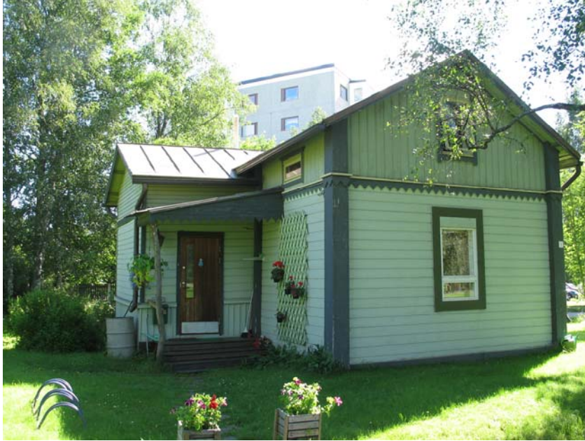
Kuva. Rakennus on asuinkäytössä vielä vuonna 2008.

Asuinrakennukseen on vuonna 1963 rakennettu sisä-wc, jolloin myös rakennuksen ikkunat on uusittu. Vuonna 1965 on liiketoiminnan kannalta tarpeellinen ikkunan suurentaminen tehty. Tämä kyseinen ikkuna jäi vuonna 1963 uusimatta. Ylivieskan kaupunki rakensi suoja-aidan tontin rajalle kerrostalojen puolelle.