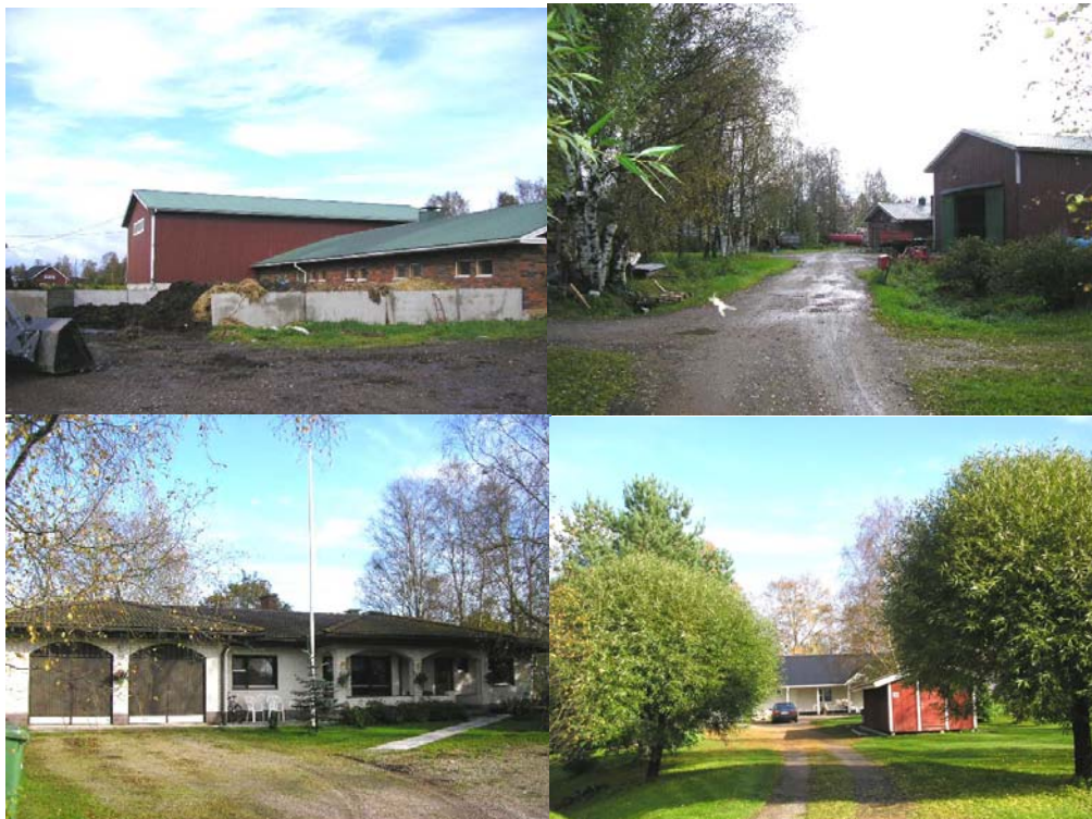
Kuvat: Niemelänpuhdo/Vanhatie Toimivan maatalouden tilakeskuksen rakennukset ja omakotitaloja tiiviinä ryhmänä keskellä Niemelänpuhdon asutusta

Joen ja maanteiden väliin on jäänyt useita tilakeskuksia, joiden toimintamahdolli- suudet nykyisellä paikalla eivät välttämättä vastaa tulevaisuuden vaatimuksia. Esimerkkinä mainittakoon Niemelänpuhdon alue, jolla on jo merkittävästi lisääntynyt pientaloasutus. Tällä alueelta on mm. vuonna 2004 lopettanut yksi lypsykarjatila , joka on muuttanut tuotantosuuntansa viljanviljelyyn. Em. tilakeskusten alueet ovatkin mahdollisesti tulevaisuudessa muuttumassa pientaloalueiksi ja esim. sukupolven vaihdosten myötä voitaisiin uudet tilakeskukset rakentaa toiminnallisesti parempiin paikkoihin.