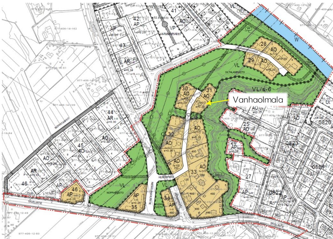
Kuva 1. Ote Männistön kaupunginosan Olmalan alueen (Olmala II) asemakaavan uudesta luonnoksesta. Nuoli osoittaa tarkasteltavan kiinteistön sijainnin.