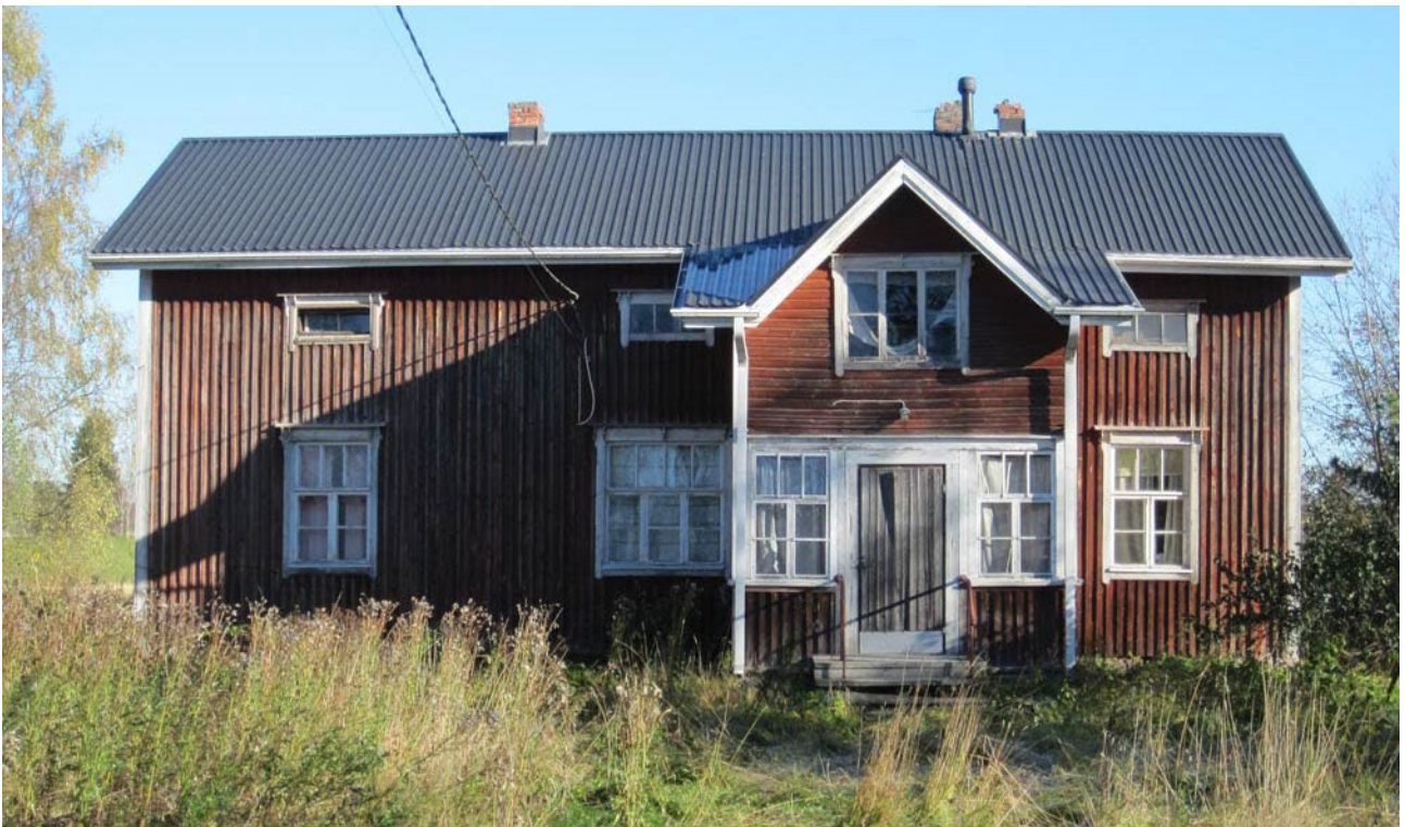
Kuva 4. Vanhaolmalan asuinrakennuksen pääjulkisivu (2015).