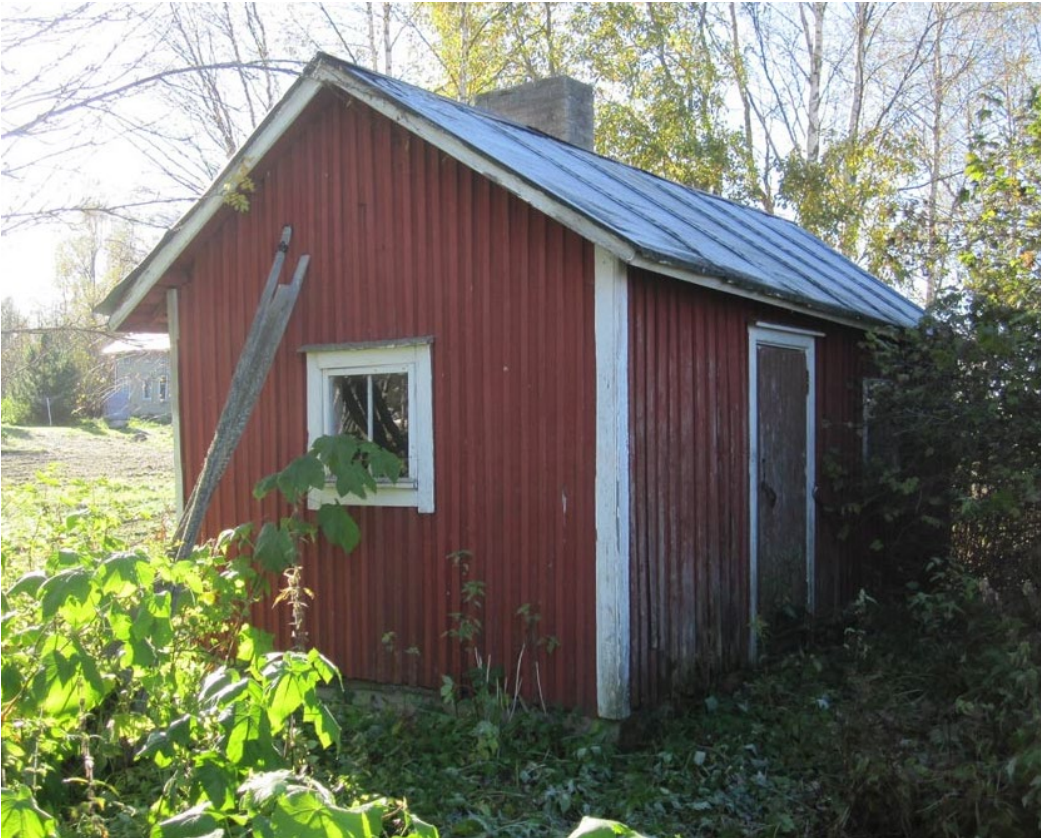
Kuva 7. Vanhaolmalan saunarakennus (2015).

Pihapiirissä on myös pienehkö harjakattoinen betonilaatalle perustettu puurunkoinen lautaverhottu saunarakennus, jonka kunto on kohtalainen.