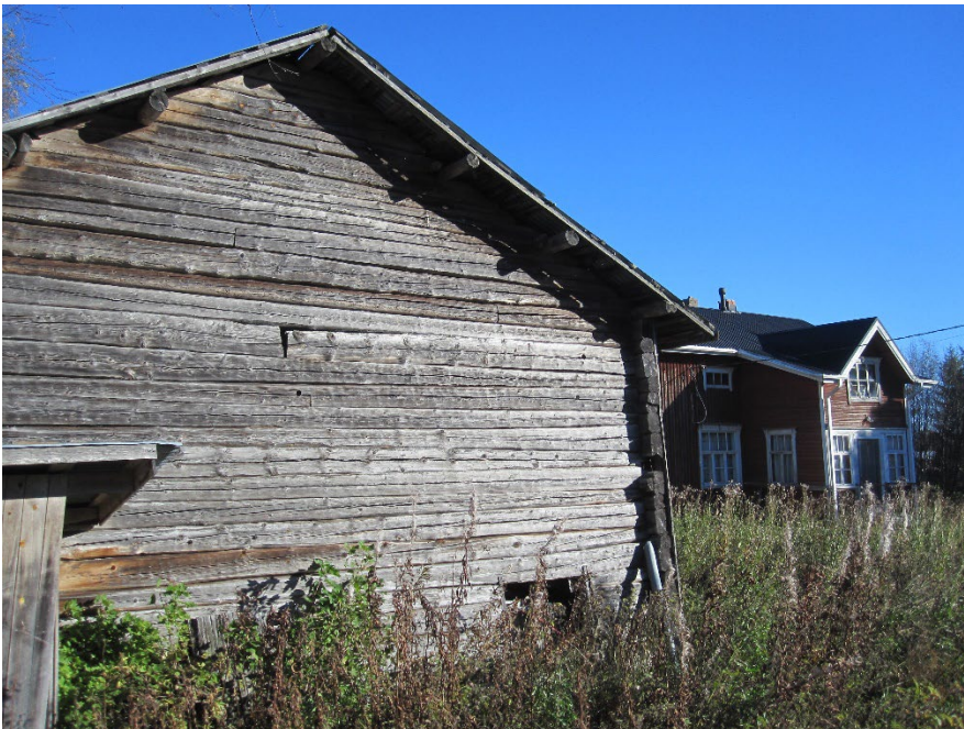
Kuva 2. Vanhaolmalan pihapiiriä. Kookas aitta ja päärakennus (2015).

Tila on asumaton. Tilalla on kolme rakennusta: lautaverhottu hirsirunkoinen asuinrakennus, hirsirakenteinen kaksikerroksinen aitta sekä pienehkö lautaverhottu saunarakennus. Pihaan johtavan tien vieressä, sen luoteispuolella on nähtävissä puretun tallirakennuksen kivijalan jäänteitä.