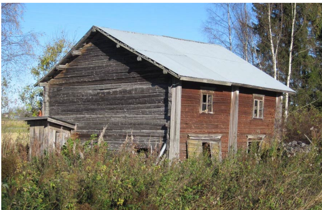
Kuva 5. Vanhaolmalan kaksikerroksinen hirsiaitta (2015).

Harjakattoinen hirsirakenteinen verhoamaton aitta on vinossa ja alimmat hirret vaativat kengittämistä. Rakennuksessa on vanhan pärekaton päälle asennettu peltikate, jonka harjalta päivä paistaa läpi. Kattovuodot ovat aiheuttaneet lahovaurioita aitan välipohjan rakenteissa. Hirsien sisäpinnassa on näkyvillä kirjoitusta ainakin vuosilta 1909 ja 1922.