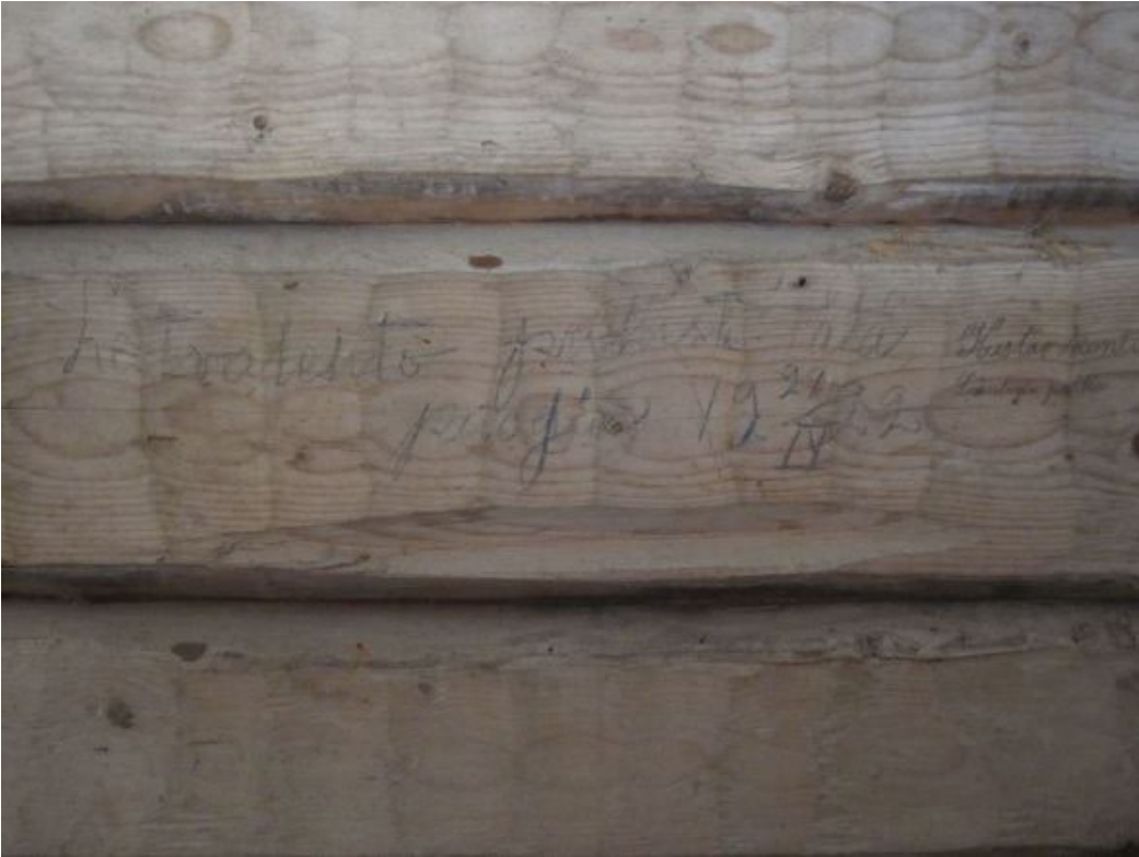
Kuva 6. Kirjoitusta Vanhaolmalan aitan hirsien sisäpinnassa (2015).

Pihapiirissä on myös pienehkö harjakattoinen betonilaatalle perustettu puurunkoinen lautaverhottu saunarakennus, jonka kunto on kohtalainen.